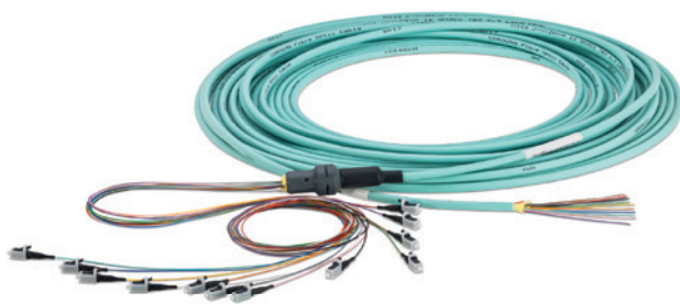
Cavo trunk, preassemblato da un lato