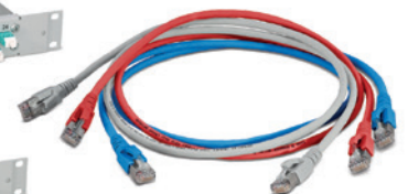
Cordon de raccordement